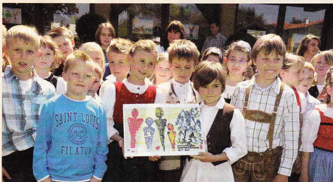
Schülerinnen und Schüler der VS Pogöriach mit künstlerisch gestaltetem Logo